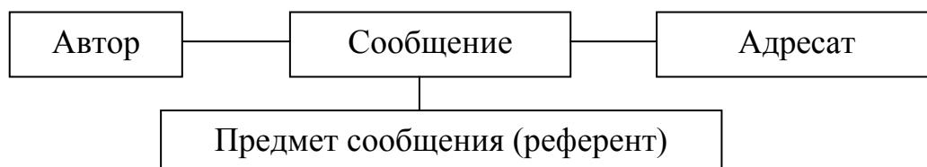
Рис. 2.1. Речевая коммуникация

Язык выполняет свои коммуникативные функции тогда, когда он реализуется в речи. Акт речевой коммуникации предполагает наличие, по крайней мере, следующих компонентов (рис. 2.1).